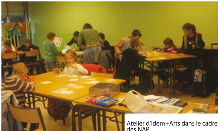
Atelier d'Idem+Arts dans le cadre des NAP

Suite à la mise en place de la réforme des rythmes scolaires à la rentrée 2014, la ville de Ferrière-La-Grande a fait le choix de s'inscrire dans cette démarche pour mieux répartir les heures de classe sur la semaine.