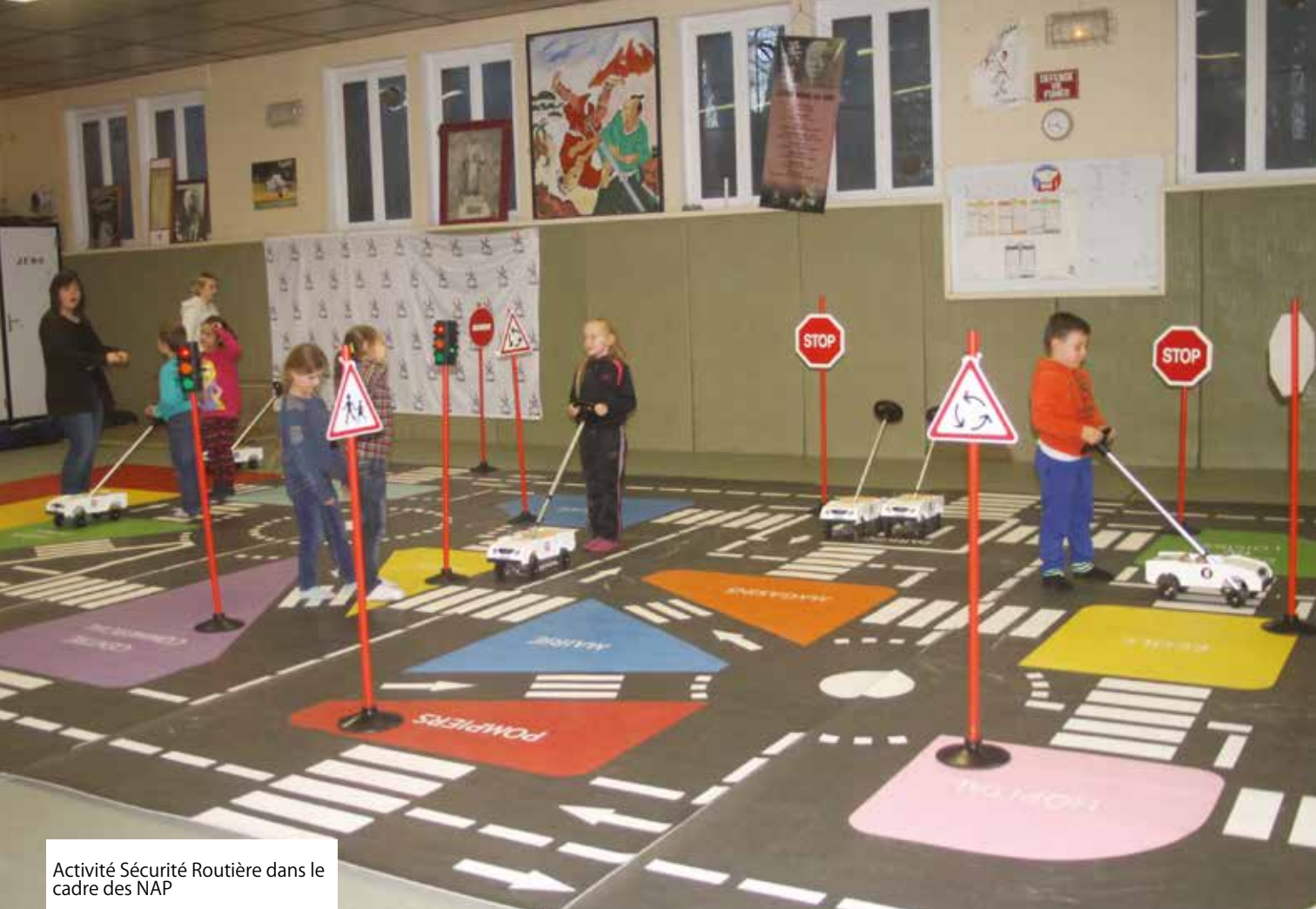
Activité Sécurité Routière dans le cadre des NAP