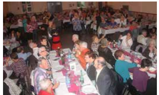
Plus de 200 personnes participent aux repas des seniors.

De nombreux projets sont à l'étude avec l'ensemble des partenaires : les seniors Ferriérois seront destinataires dans les toutes prochaines semaines d'un courrier afin de recueillir leur avis sur les activités que nous pourrions proposer.