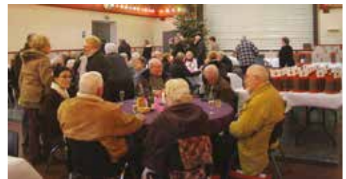
Un moment très convivial lors de la distribution des colis aux seniors