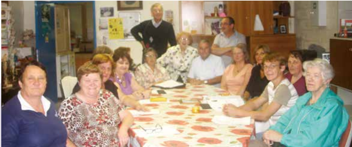
L'équipe de Saint Vincent de Paul